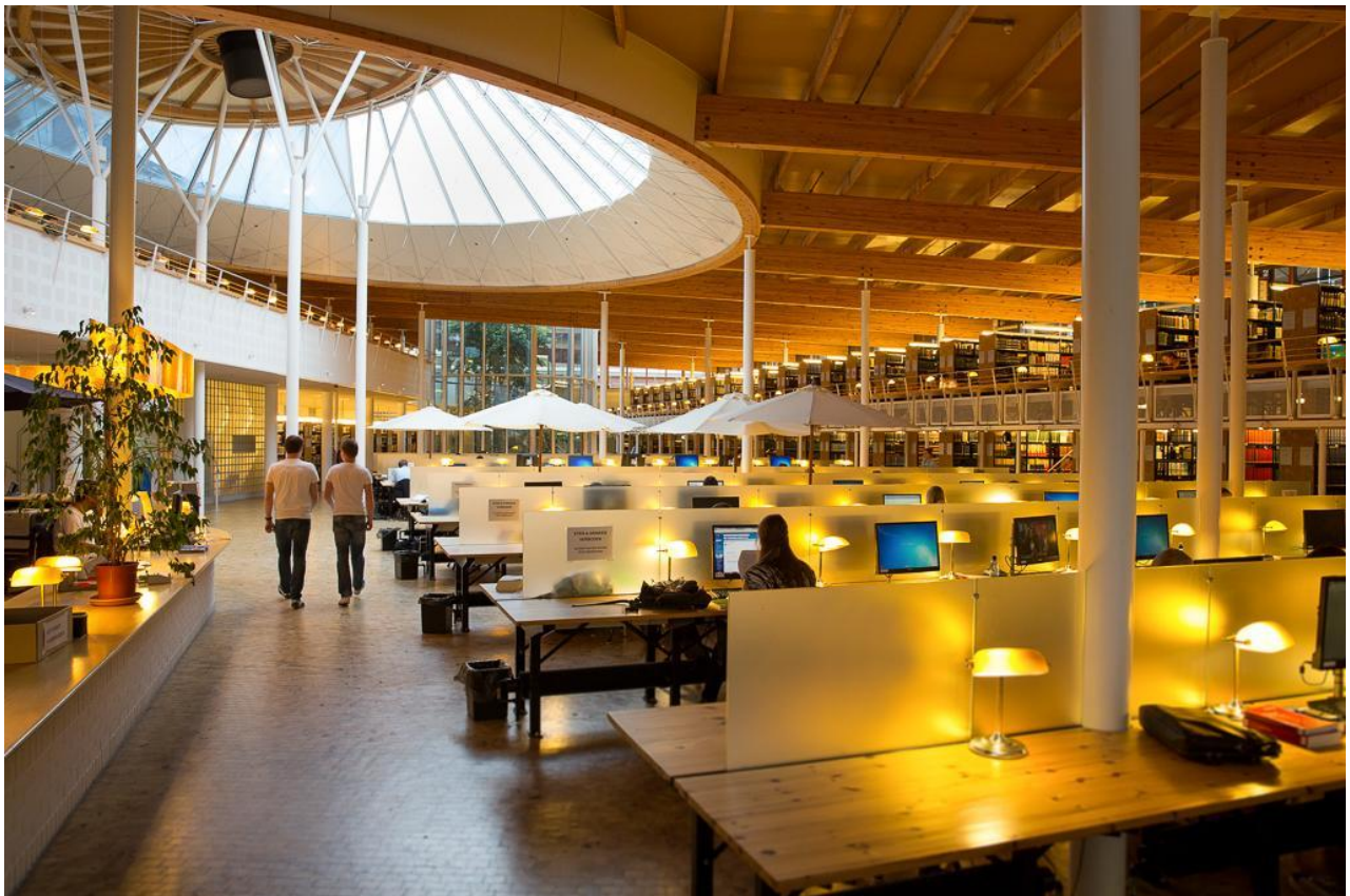
Leiden Law School

Κάθε χρόνο διοργανώνεται έκθεση ολλανδικών πανεπιστημίων υπό την αιγίδα της ολλανδικής πρεσβείας και του Ολλανδικού Ινστιτούτου Αθηνών.