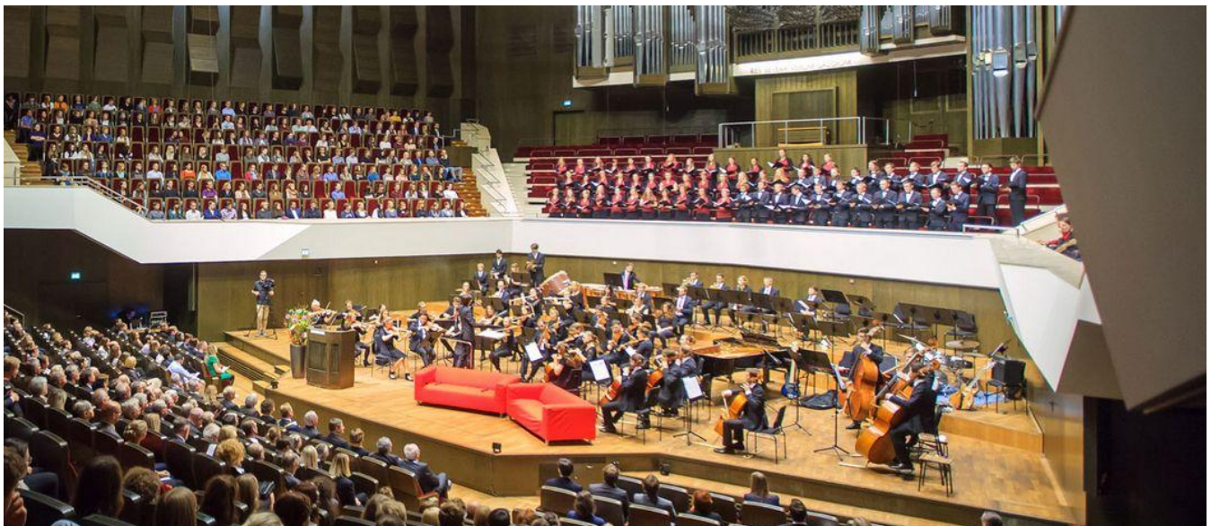
Τελετή εγγραφής (Immatrikulationsfeier) του Universität Leipzig 2025