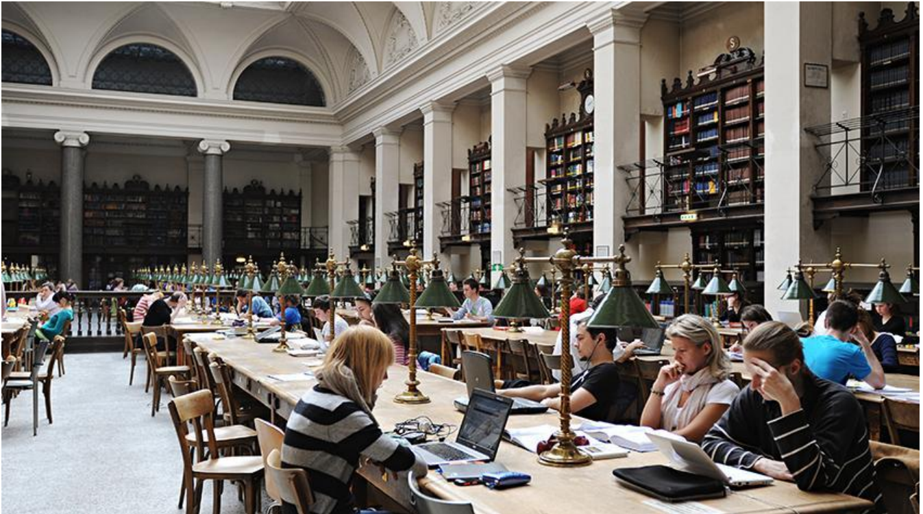
Faculty of Social Sciences, University of Vienna, Main Library

Ο καθένας που επιθυμεί να σπουδάσει σε αυστριακό πανεπιστήμιο, εφόσον πληροί κάποια βασικά κριτήρια έχει ελεύθερη πρόσβαση στην αντίστοιχη σχολή.