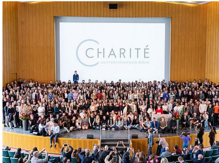
Τελετή εγγραφής (Immatrikulationsfeier) του Universitätsmedizin Berlin